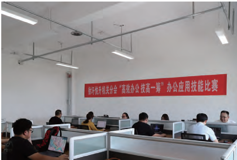
近日,徐圩投资公司工会在悦升公司环卫运营管理中心举办“高效办公、技高一筹”办公软件实操技能竞赛,18名选手围绕 Word 编辑、PowerPoint 操作、Excel 等四项实操进行角逐。(许传祚)

统筹安全发展,确保发展实效。有计划推进项目建设。要按程序推进中型灌区申报工作,尽快邀请第三方完成现场勘测和材料编制,争取进入全国中型灌区名录。要因地制宜,积极推进三峡渔光互补项目区高标准池塘改造。积极推进大新农场农路建设和看护房统一规划。做好两节期间维稳工作。中秋、国庆佳节将至,组织双节安全大检查,对农机使用、租赁场所用电、消防安全等重点领域严密排查,及时下发整改通知书及时研判职工思想动态,切实消除问题和矛盾,营造和谐稳定氛围。(顾 益)