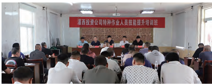
近日,灌西投资公司举办特种作业人员技能提升培训班。进一步强化特种作业人员的安全意识并提升其专业技能,确保公司安全生产形势持续稳定。(西安 宣)

全生产月”活动为契机,梳理安全生产侧重点,开展风险辨识、安全检查及消防演练活动、安全知识答题等活动。全力做好防汛工作,加强汛期巡视巡