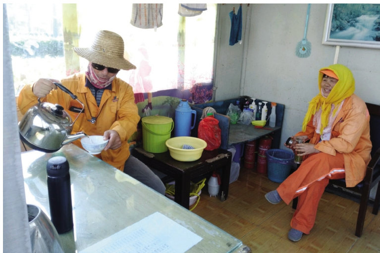
日前，台北临达工贸公司针对我市气温连连攀升的实际，秉持“企业前行，慈善在心”的公益理念，无偿为周边环卫工人设立“爱心休息站”，配备了空调、电视、桌椅以及防暑降温药品，每天组织志愿者准备好开水，及时为环卫工人补充能量。