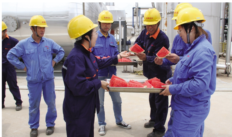
入伏以来,热浪滚滚。利海化工公司开展夏季“清凉进一线”系列活动,为一线员工发放了绿豆、饮料、雪糕、西瓜、龙虎人丹、清凉油等共计8.3万余元的防暑降温用品和防蚊虫叮咬中暑药品。图为该公司管理人员为一线员工送西瓜。(顾孟)

新华茂人依然传承了这种“吃苦耐劳、勇于拼搏”的精神,跟老员工一起,齐心协力连续奋战在生产第一线、创文最前沿,用辛勤的汗水换取城市的洁净和美丽,助力创文再加速,力推进向新高度。(王芬)