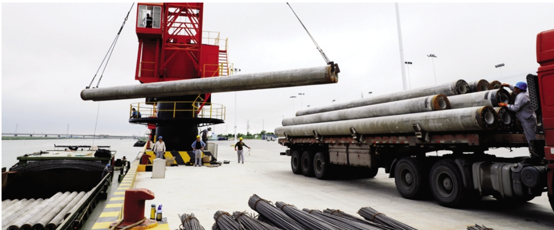
连日来，在灌西青洋五灌河码头，一台大型吊机一字排开，竞相飞舞着吊臂，不停吊运管桩。运输吨袋、管桩、钢材的卡车穿梭码头，井然有序。运营以来，灌西青洋物流分公司积极应对市场变化，不断加大货源开发力度，有效促进了五灌河码头生产运行态势保持平稳增长。图为码头正在卸载管桩。（张明建）

实现全年目标有任务。以“高质高效、创新创优”为核心要求紧盯全年目标不动摇，狠抓问题整改不松劲，聚焦主业增效益，深化改革提质量，重点落实产业升级、生产销售、招商引资、人事改革、资金管理、资产清查、问题整改及作风建设“八大任务”，推动安全环保型产业发展，降本增效树品牌，重视培育企业“本土人才”，推行“宽带薪酬制”，不断优化产权结构，加快债权清理，推进融资计划，努力形成新的经济增长点，促进产业提效、改革提速、管理提质、效益提升。（工宣 陈健）