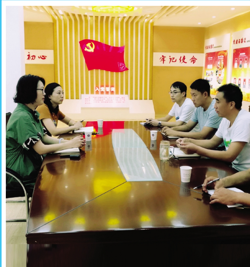
连日来，华茂绿化公司纪检监察部门深入各分公司开展集体廉政谈话活动，突出对基层单位班子成员的制约，敲警钟、严纪律，全面贯彻落实从严治党“两个责任”，为企业改革发展稳定保驾护航。