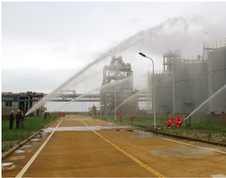
近日，利海化工公司组织80余人开展应急救援演练，模拟甲苯在卸料过程中，因静电积聚产生电火花引燃甲苯，形成爆炸混合体，将会发生爆炸，继而波及到甲苯储罐，有可能造成更大的人员伤亡事故。此次演练进一步提高了公司危险化学品火灾事故应急救援实践能力和全员安全生产意识。(郁洪兵 梁娟)