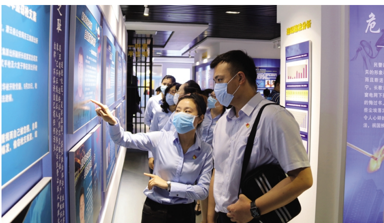
7月3日下午，资产管理公司党支部组织40名党员干部职工赴连云港市“警示教育学校廉政教育基地”开展党风廉政警示教育。进一步打造一支“信念坚定、作风务实、清正廉洁”的金融服务队伍。(李莘江)

建强小队伍，让党员动起来。针对不同岗位的党员开展争“星”创优活动，通过开展“找星、晒星、评星”活动，激励党员争做创业先锋。今年以来，该公司党委结合党内主题教育实践活动开展，围绕安全生产、创新创效等方面广泛开展“千吨格块”、“十万元岗”、“服务创新标兵”争创活动，年初开展找星活动选树典型，年中开展晒星活动宣传典型，年底开展评星活动，争创增收创效之星、改革创新之星、优质服务之星。(季兴胜)