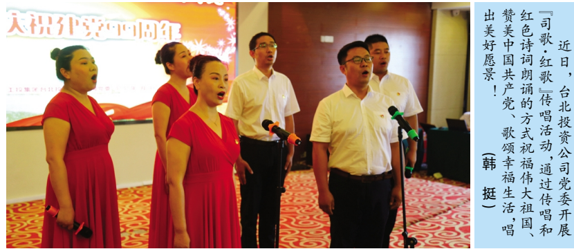
近日,台北投资公司党委开展“司歌·红歌”传唱活动,通过传唱和红色诗词朗诵的方式祝福伟大祖国、赞美中国共产党、歌颂幸福生活,唱出美好愿景!(韩挺)