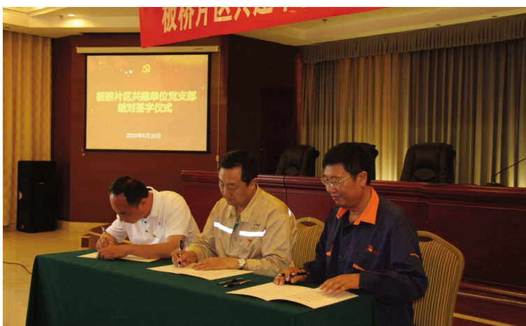
为进一步推进板桥区域联动共建活动向基层党支部拓展，日前，板桥片区共建单位“结对共建、互促提升”基层党支部结对共建签字仪式在利海化工公司举行，利海、金桥制盐、氯碱、徐圩悦升瑞南养护分公司等12个支部党组织负责人签署结对共建协议书。(梁娟)

近年来，供电公司党委高度重视党建考核工作，全面落实党建工作责任制，通过多种举措不断提升公司党建水平，在全体党员中掀起全员大考核的热潮。