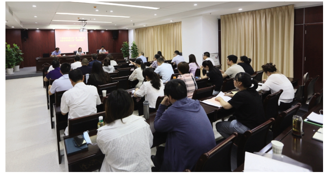
7月10日,集团公司举办“干部选拔任用工作”暨“干部人事档案专项审核工作”培训班,来自各单位的40余名干部人事管理和人事档案管理人员参加培训。(工宣 人力资源部)