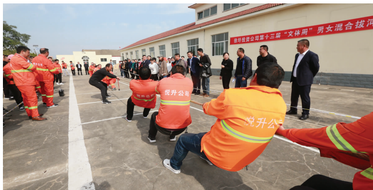
10月26日,徐圩投资公司第十三届职工“文体周”隆重开幕,来自各分会的12支代表队在拔河、台球、摸石过河、趣味积分投球、合力搭建、书画摄影展等12个趣味性比赛项目展开为期一周的角逐。(王敏)

下好“一盘棋”,造就一支敢担当讲奉献的职工队伍。围绕“高质高效、创新创优”发展主题,深入开展以“改革提质增效、创新增效促发展”为主题的劳动竞赛,推动企业岗位练兵、技术比武活动,提升职工参与率,扩大活动覆盖面。以产改为引擎,构建机制、搭建平台,选树引领职工建功新时代示范行动典型。(张明建)