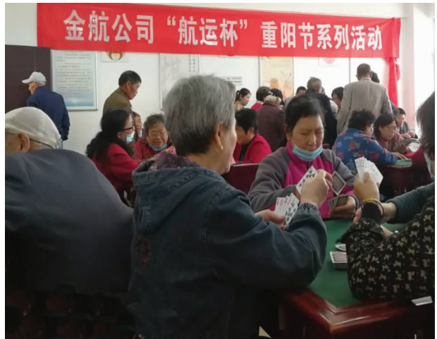
为进一步弘扬中华民族尊老敬老的传统美德,让老人们过一个快乐的重阳节,10月23日下午,金航资产公司在昌圩湖社区活动室精心组织了一场扑克、象棋、台球比赛。此次活动共有近三百名公司退休职工参加。(卢新全)