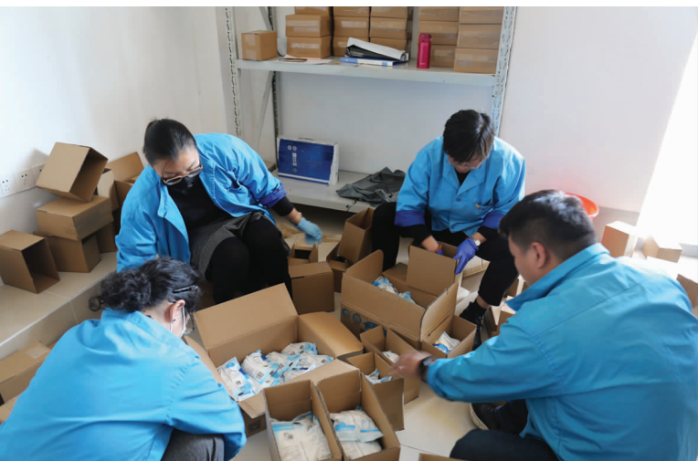
金桥制盐公司天猫商城网店开业以来,日接小包装食盐订单近5000单。面对48小时内发货的巨大压力,公司机关管理人员第一时间响应号召,到网店库房帮忙打包封箱贴面单,确保所有订单准时发出。(金宣)

区和商业街区开展创文宣传活动。志愿者们分片进入商户,耐心、详细地给居民群众解答困惑,认真倾听群众对深化全国文明城市工作的意见建议,发放《致全体市民关于创建全国文明城市的倡议书》和《灌云县创建全国文明城市提名城市问卷调查》等。目前已完成入户100余户。(邱利民)