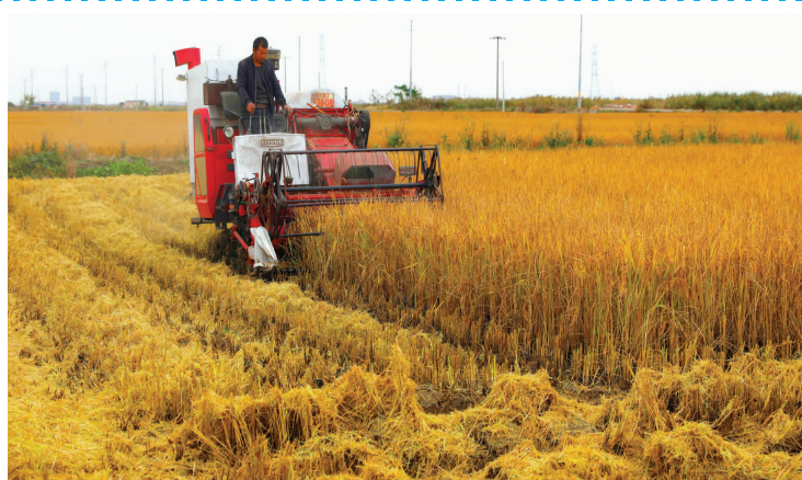
稻谷飘香,进入丰收的季节。10月28日,青口投资公司万亩稻田开镰,拉开了2020年水稻收割大幕。该公司为了确保颗粒归仓,提前制定秋收工作方案,成立秋收工作组,分工明确,责任到人,预计半个月时间完成全面收割任务。