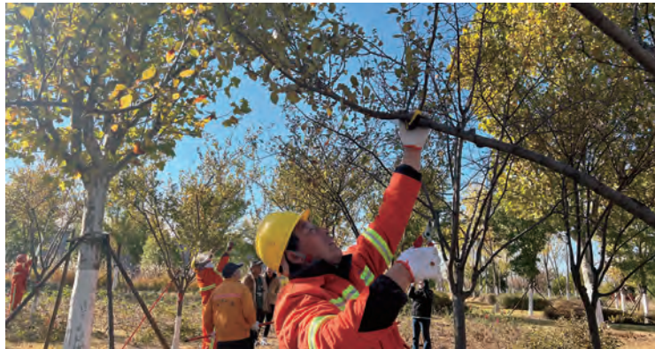
11月17日,台北·华茂公司开展“技能比武筑匠心 岗位练兵促提升”职工技能比武大赛,参赛的31名员工在树木涂白、横纹修剪、城市家具保洁、花灌木修建等四个项目中展开角逐,进一步弘扬工匠精神,打造企业核心竞争力。(北工)

益为导向,在节流上做减法,精打细算“节流账”,把过紧日子的长效机制运用到全年预算编制中,严控“三公”经费预算,实行源头控制,减少非生产性费用支出;扎实开展生产技术、经营管理、财务管理等方面的创新创优,深入开展降本增效、技改创新活动;加强市场调研,灵活销售策略,实现效益最大化。深化“三精”管理,冲刺全年目标任务、谋划明年工作思路,针对不同阶段出现的不同问题进行系统分析,确保每个环节都落实到位,每项措施都落地见效,每个难题都有效解决,以打赢减亏增效“攻坚战”助推企业高质量发展。(张昕)