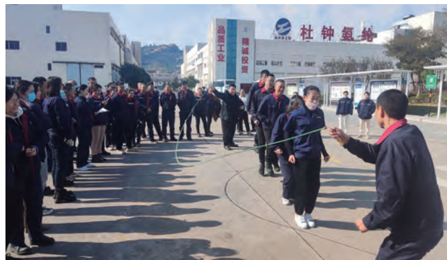
11月13日-17日,氨纶公司举办第三届职工文体周,全体职工在拔河、跳绳、掷蛋、踢毽子、呼啦圈和趣味活动项目展开角逐。(韩奇)

开设“实践课堂”,提高党员能力素质。深化“互联网+党建”的“智慧课堂”,组织职工在“学习强国”“江苏先锋”等线上平台开展党的创新理论、路线方针政策、党建知识学习。同时采取“课堂教学+实践培训”的方式,围绕产业发展、工艺革新、提质增效等领域,开展专题研讨、岗位大练兵,培养一支“懂生产、精业务、爱钻研”的能工巧匠队伍;组织志愿服务队参与安全生产、人居环境整治、风险隐患排查等工作,践行为民服务理念,提高职工综合能力素质。(许东彦)