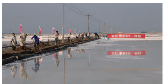
11月15日,灌西投资公司“薪火灌筑 匠星西传”师徒结对擂台赛在新河、埭南制盐分公司的盐滩现场拉开帷幕,晒得黝黑的盐场产业工人们做熟泥、打堰墙、做堰顶,护坎顶、夯埧坡、清塘底,经过一天的鏖战,分别评选出池堰修整、土塘清淤两项技能突出的前三名。(杨婕)