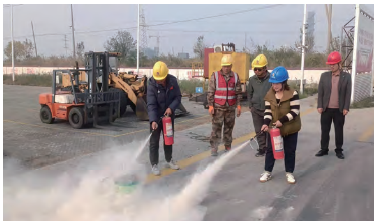
近日,灌西肖洋物流公司扎实开展消防宣传月活动,通过观看视频、案例分析、问卷调查等多种形式,广泛开展宣传教育。并以“理论+实践”的方式结合码头安全生产,进行消防安全实操培训。(许东彦 胡秀同)